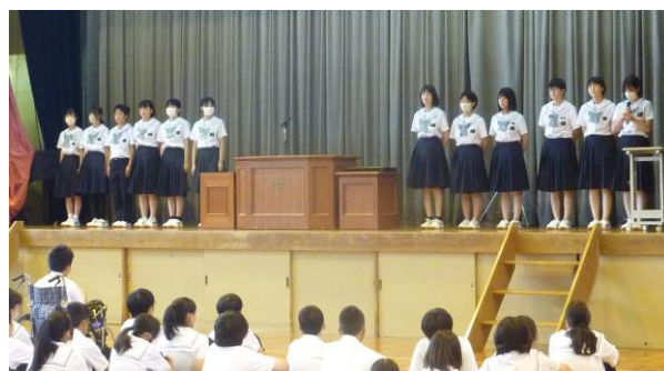
【部活動激励会で意気込みを発表する各部】

6月28日に「部活動激励会」がありました。県総体中部ブロック大会を勝ち進み、県総体出場に挑む部、各種大会・コンクール・公演に出場する部、各種出展に向け制作活動する部、それぞれの部が力強い意気込みを堂々と発表してくれました。目標に向かって頑張っている皆さん、仲間と共に絆を深め、周りの支えに感謝する気持ち、くじけそうになる自分を振るい立たせ闘いに挑む皆さん方の熱い思いに感動しました。