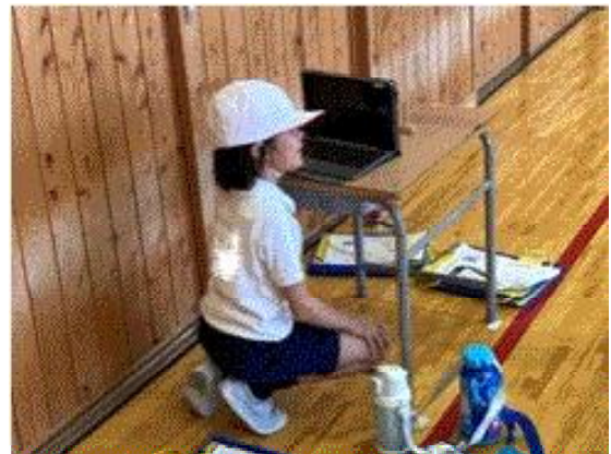
(友だちの動きを見逃さないように)