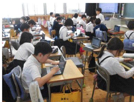
(それぞれの課題意識で進めて)

6年生 は、修学旅行のパンフレットのために、調べたり、まとめたり。また、別の場面では、自分の考えをまとめて、友達と交流していました。