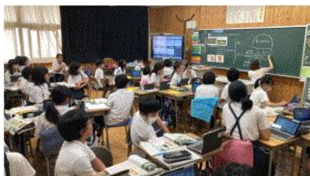
(自分の考えを整理しまとめて)