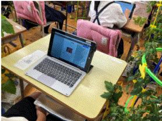
(文と写真をおりまぜて…)

2年生 は、ミニトマトの日々の成長の様子を撮影して観察日記にまとめたり、体育では動きを撮影して確認して次の学習に活かしたりするなど手慣れたものです。