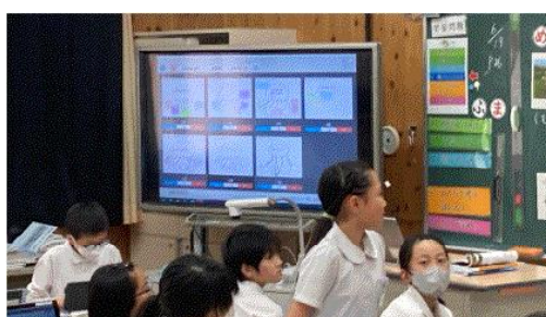
(他の人たちと交流して)

タブレットの活かしどころを考えながら、また楽しさを味わえるように工夫しながら取組を進めています。