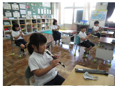
リコーダー講習会→