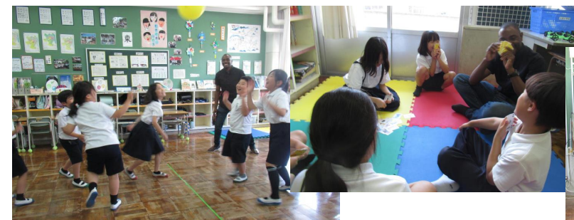
風船バレーやトランプをしました。