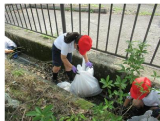
校区内クリーン作戦