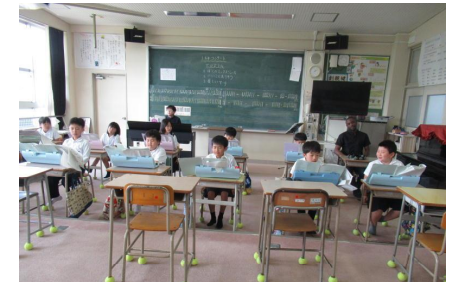
音楽の時間にミニコンサート