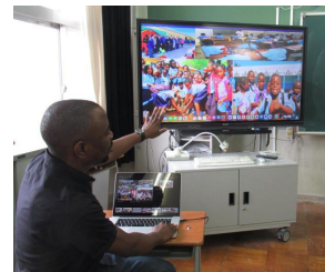
モザンビークの紹介