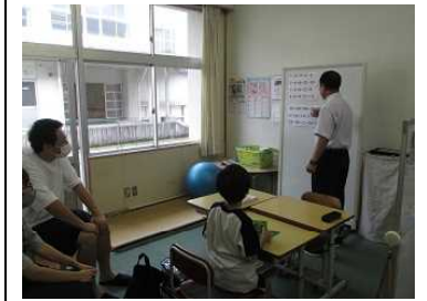
すくすく【算数】 「星の数はいくつ」