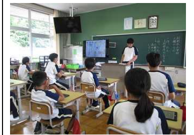
6年【道徳】「人権かるた」