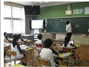
4年【算数】「垂直と並行」