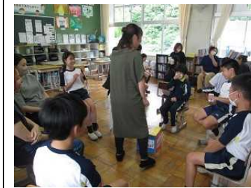
5年【外国語】 「What ○○ do you like?」