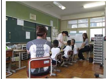
わくわく【道徳】 「かっこいいあいさつ」

6月21日(金)、今年度、2回目の授業参観がありました。新しい学年や教室にも慣れ、4月の授業参観時から成長した、子どもたちの姿を見ることができたのではないのでしょうか。参観後の引き渡し訓練もご協力ありがとうございました。