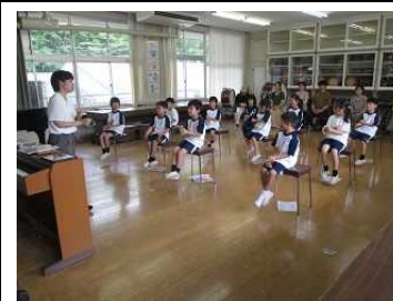
1年【音楽】 「ジェンガのリズムであそぼう」