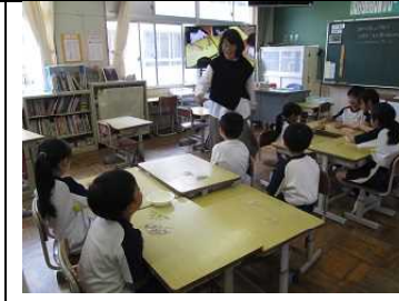
2年【算数】 「100をこえる数」