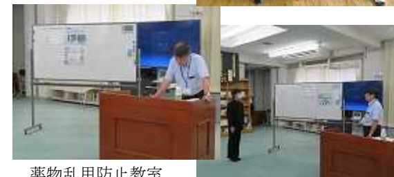
薬物乱用防止教室 原稿見ずにお礼の言葉が言えるのはさすが