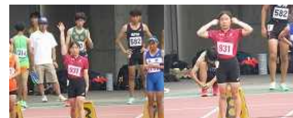
通信陸上 100M、200M決勝進出！早朝練習頑張った