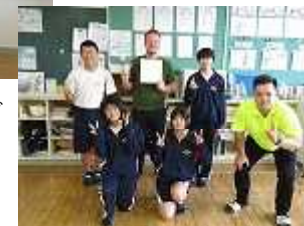
楽しい授業をありがとうございました。