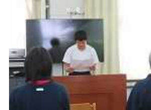
勇気をだして作文披露