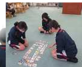
盛り上がる人権かるた