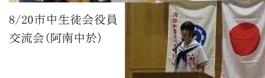
8/20市中学生役員 交流会(阿南中於)