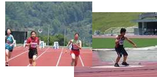
市中陸上競技大会