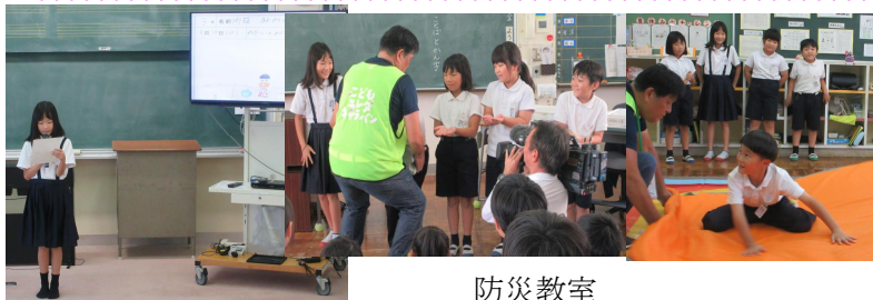
チャレンジ発表会