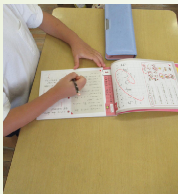
木曜日朝の活動「ことばの時間」

また、6月末から各学級で研究授業も実施しています。真剣に取り組む児童の姿には毎回感心させられます。本日、通知表を持って帰りますが、子どもたちの頑張りを褒めていただければと思います。