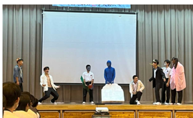
「7組 劇場版アラティン」