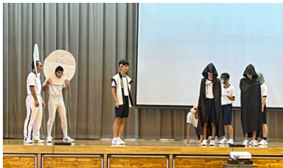
「3組 桃から生まれたゆうたろう」