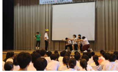
「4組 ポンコツ王子と美人シンデレラ」