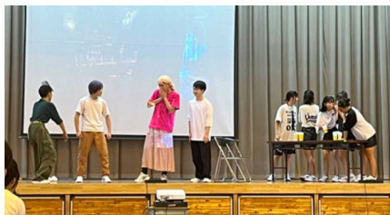
「5組 私たちの知らない塔の上のラフンツェル」