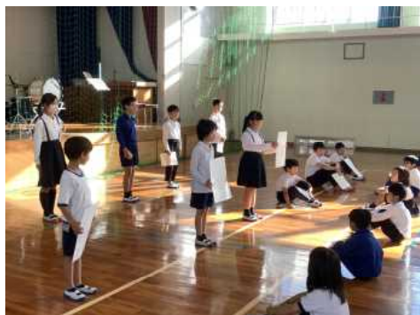
◎朝会で、6人の児童の表彰と人権標語の発表が行われました。