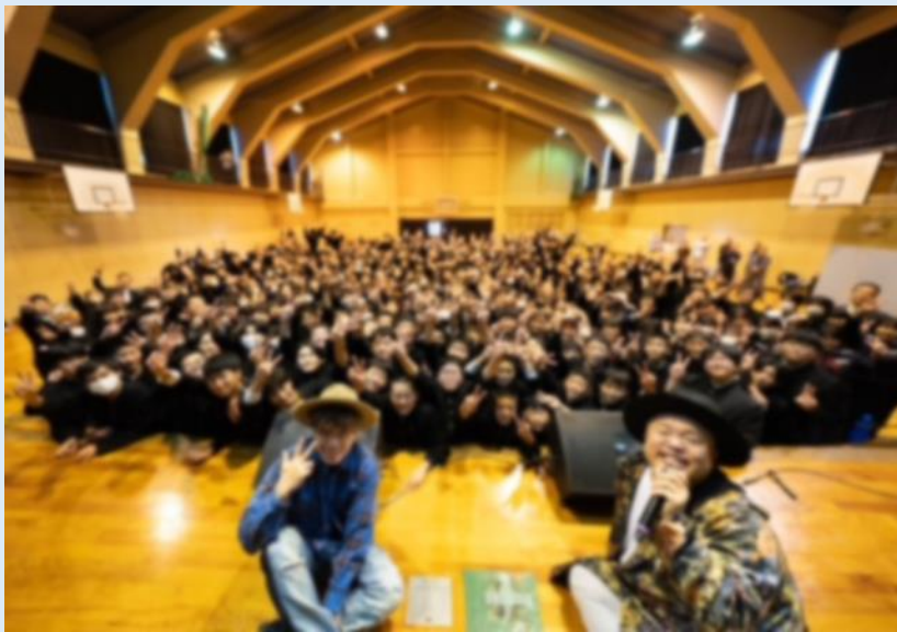
【HIPPY さんとの記念撮影】