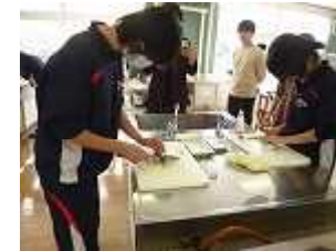
2匹さばいた人 もいました