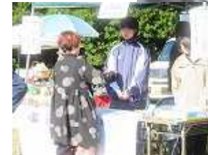
丁寧に接客 します