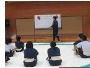
最初少し緊張 気味でした

12月11日(水)、阿南二中と交流学習をしました。目標は「リズムにのって演奏しよう」です。紙コップと手で音をだし、拍子と組み合わせるリズムを作る「カップス」という楽しい音楽の授業でした。今回は、本校の保護者にも参観していただいた後、保護者説明会がありました。学校の様子が分かり、少し安心されたようです。二中の先生方に感謝いたします。