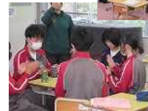
グループで リズムよく♪