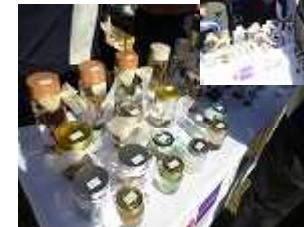
心を込めて作っ た作品の数々