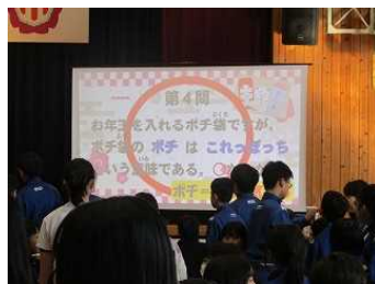
あけ・おめ・集会 1月16日