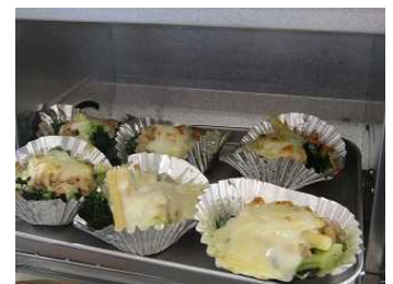
ひまわりタイム (育てた野菜でグラタンづくり)