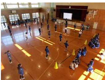
縄跳びチャレンジ大会 1月30・31日