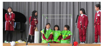
【劇：わかり合って すてきだね】