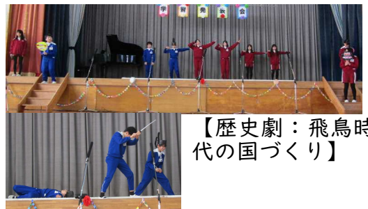
【歴史劇：飛鳥時代の国づくり】