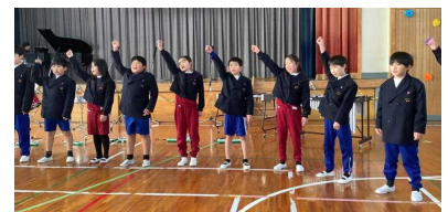
【合奏「やってみよう」 合唱「世界を旅する音楽室」 「カノウ星人のうた」】