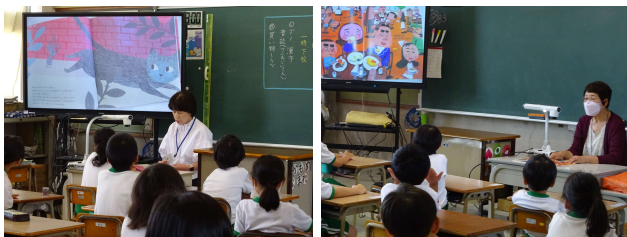
【絵本の読み聞かせ】