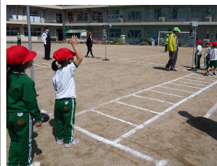
【道路の歩行練習】(1年生)