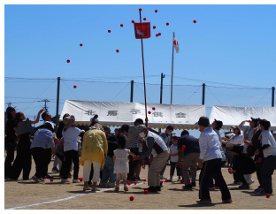
【地域住民参加種目】