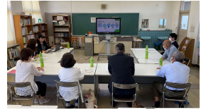
【第1回学校運営協議会】