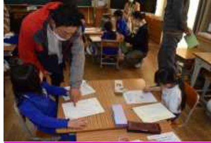
少し手伝ってもらいながら書いています。