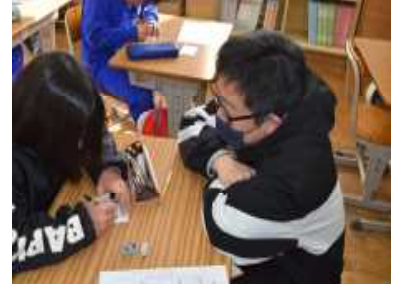
作業所の惣菜につけるカードに親子の心をこめて