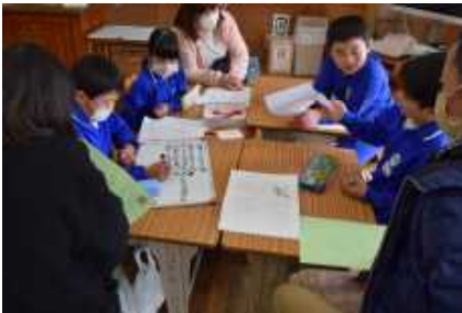
各家庭で考えたことを、グループで広め、深めます

保護者の皆様、学校運営協議会の皆様をお招きし、人権教育参観を開催しました。おいそがしい中、また、寒さ厳しい中ご参加いただきありがとうございます。前半の公開授業、後半の家庭教育研修それぞれで子供たちに温かくはたらきかける保護者方の姿に、子供達の自分や他者を大切に作る心や態度は、まさしく家庭が基盤となっていることを実感しました。3年生の「女だから？男だから？」の授業で、「女の子だからお手伝いしてよ！」ということはどう思いますかという問いかけに、「いつも〇〇家は全員で手伝っています。」と答えていました。あすなる作業所を支援するワークショップでは、教育部の方のコメントにより、子供達の活動に「地域貢献」、「共生」という意味づけをしていただきました。差別や偏見のない社会にするため、その社会の一員となる子供達にしっかりと人権感覚や主体的な態度を育てたいと考え取り組んでいます。参観日にご参加いただいた保護者の方の姿から人権教育に取り組む心強いパートナーの存在を感じました。