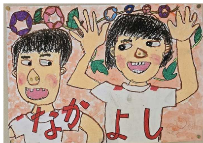
↑ 人権ポスター ← あいさつ ツツジっ子ちゃん