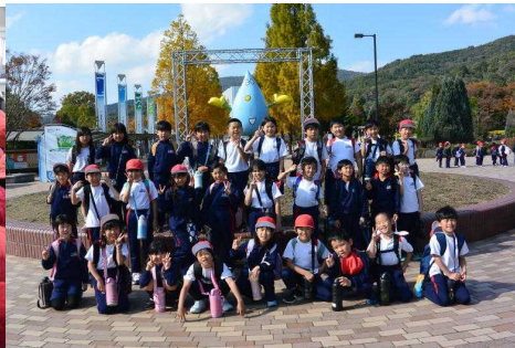
2年生 (あすたむランドにて)