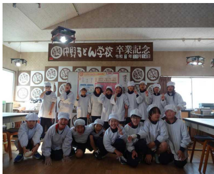
5年生 (中野うどん学校にて)