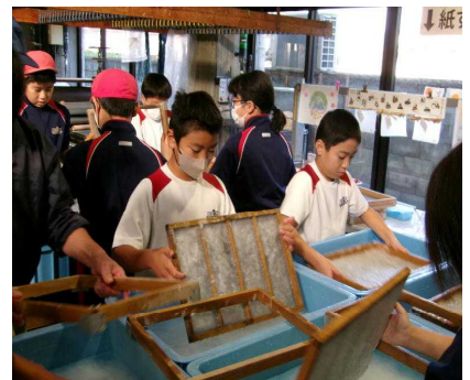
6年生 (阿波和紙伝統産業会館にて)