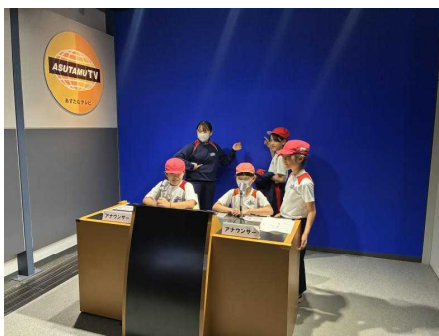
4年生 (あすたむランドにて)