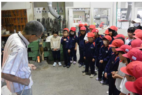
1年生 (ガラススタジオにて)