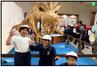
〈下学年：県立博物館にて〉