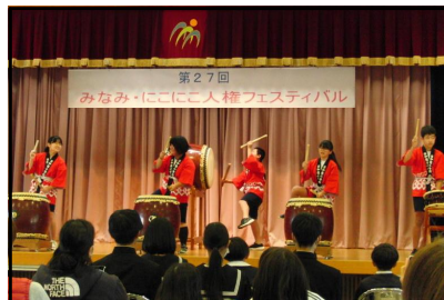
〈日本文化クラブのオープニング〉

11月22日、日和佐公民館において、人権フェスティバルがありました。フェスティバルのスタートは、日和佐小学校の日本文化クラブによる日和佐太鼓で華々しいオープニングをかざることができました。その後、人権標語の表彰式や人権コンサート、様々なコーナーもあり、みんなで人権について考えることができるよい機会となりました。