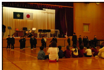
〈園児との対面式の様子〉

11月26日、1年生が、日和佐こども園（5歳児）のみなさんを招待し、恒例の「ひわさっこフェスティバル」を行いました。グループごとに、いろいろと工夫をしながら、みんなが楽しめるお店を開くことができていました。1年生は、園児のみなさんのお兄さん、お姉さんとして、がんばることができていました。