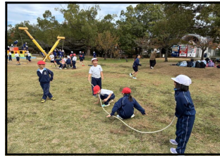
〈下学年：文化の森総合公園にて〉