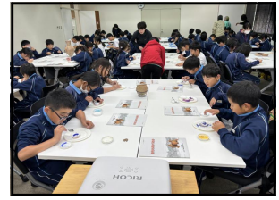
〈上学年：レキシルとくしまにて〉