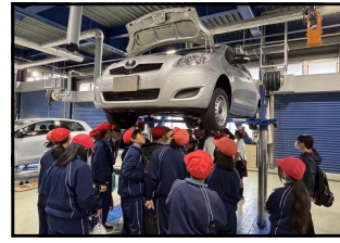
〈上学年：徳島工業短期大学にて〉