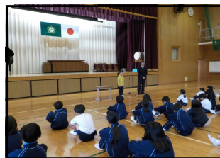
〈全校集会での自己紹介の様子〉

11月10日から20日まで、兵庫県から、2年生1名がデュアルスクール生として、日和佐小学校に来てくれました。学習や様々な行事をともにし、デュアルスクール生にとっても、日和佐小学校の子どもたちにとっても、よい思い出を作ることができました。