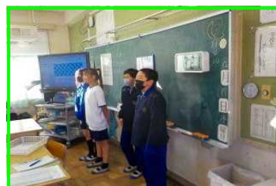
【6年生が動画の紹介をしている様子】