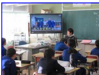
【6年生が作成した動画を視聴】