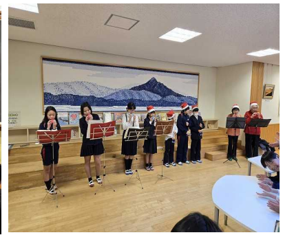
クリスマスコンサート 12月19日（金） オカリナクラブ