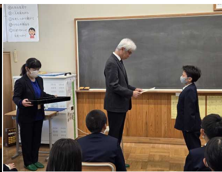
SATOURIジュニアリーダー認定証交付式 12月17日（水） 4年生