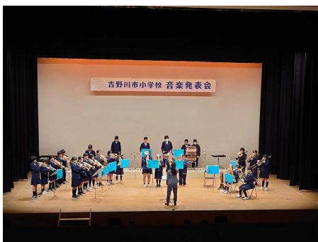
吉野川市小学校音楽発表会 11月28日（金） 金管バンド