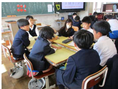
3・4年生 授業の様子

このいじめ防止一斉学習を通して、「いじめは絶対ゆるさない」との意識を高め、行動にうつせるようにしましょう。