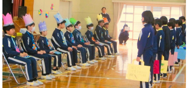
【バックのプレゼント4年生】