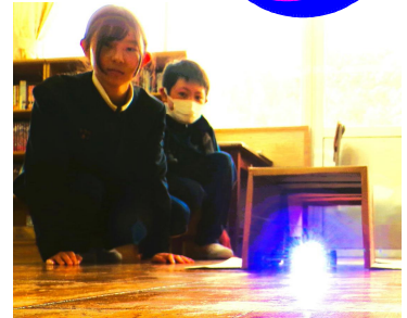
《トンネルに入ると点灯、出ると消灯。》