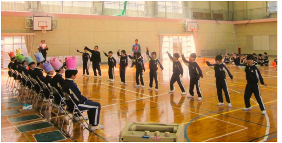
【すきすぎて滅(めつ)! 2年生】