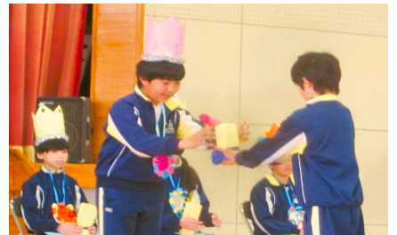
【トロフィー贈呈5年生】