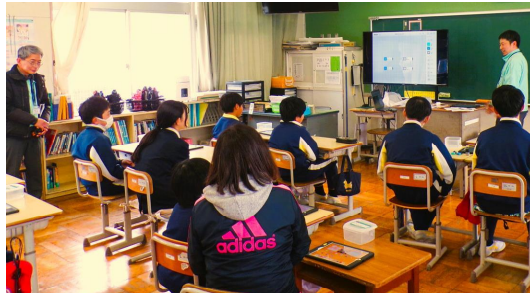
《操作を試行錯誤しながら》