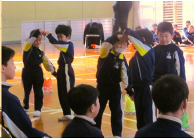
【ハートのポーズ1年生】