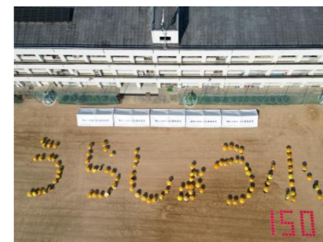
150周年記念写真 みんなで作った人文字