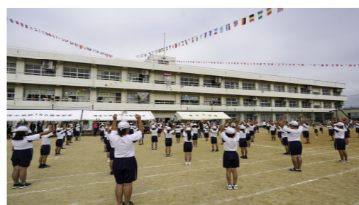
浦庄幼・小大運動会 児童・園児が主役