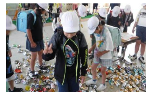
ボランティア活動の推進 アルミ缶回収で今年も車椅子を