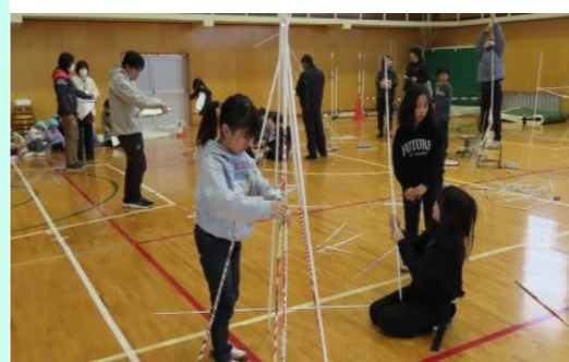
学びのかけ橋プロジェクト 幼・小・中の連携推進(公開授業)