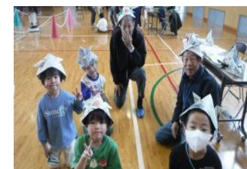
昔の遊び体験 紙飛行機・けん玉・あやとりなど