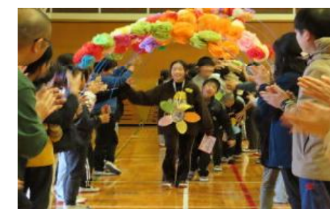
6年生を送る会 温かい心を伝え合う集会活動