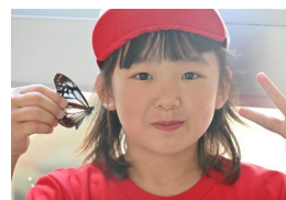
今年のマーキング1頭目

生徒玄関前に咲くスイゼンジナに誘われ、4月10日(金)今年1頭目のアサギマダラが姿を見せてくれました。現在、6頭マーキングしています。今年も海を渡る蝶の夢と浪漫を追いかけて、5月15日(金)に『アサギマダラマーキング遠足』を開催いたします。地域や保護者の皆様のご参加を心よりお待ちしております。ご希望の方は、お気軽に椿小学校までご連絡ください。