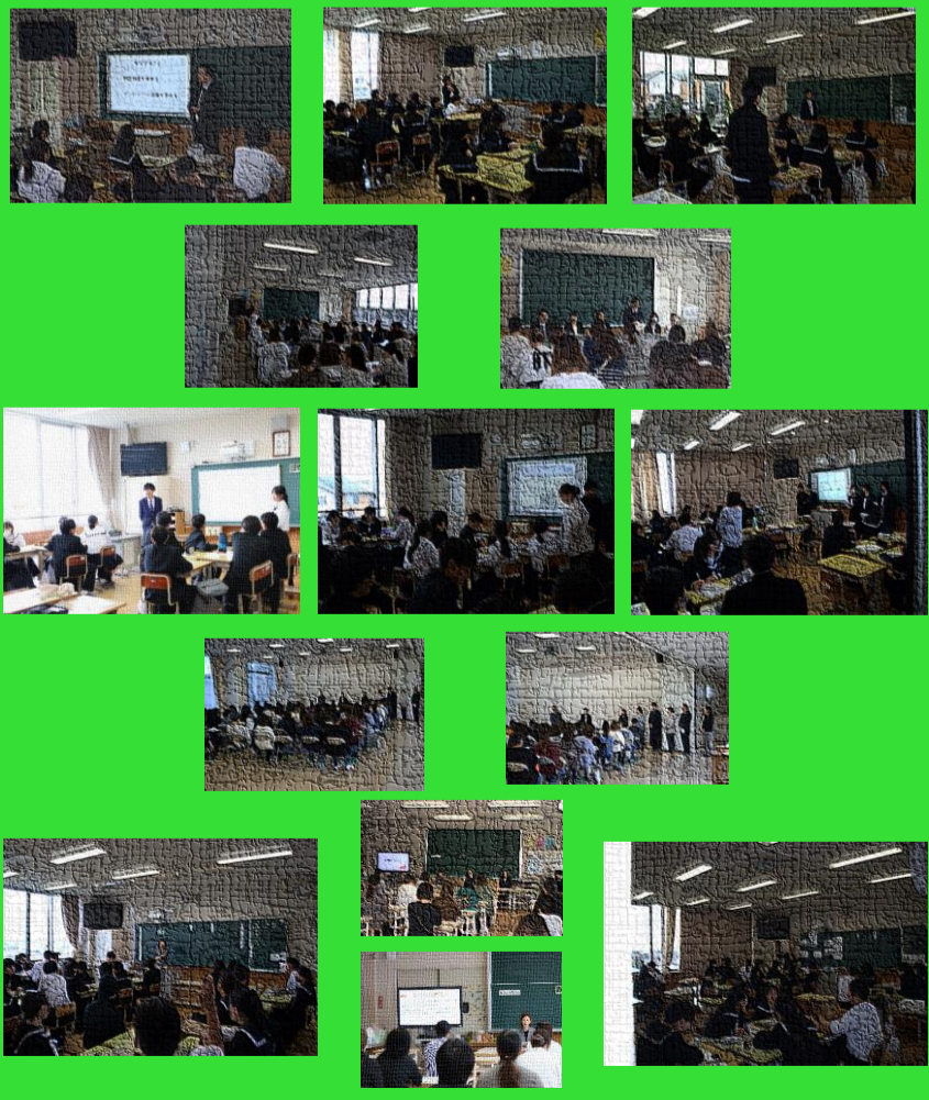
参観日授業・学年部会風景 4月28日(火)

新緑がまぶしく、風のやわらかさに初夏の訪れを感じる季節となりました。校庭の木々も日ごとに色濃くなり、生徒の活動にも一層の活気が見られます。 さて、先日はご多用の中、家庭訪問並びにPTA総会にご参加いただき、誠にありがとうございました。保護者の皆様と直接お話しする中で、お子様の様子やご家庭での思いに触れることができ、大変有意義な時間となりました。いただいたご意見やご要望を、今後の教育活動にしっかりと生かしたいと思います。 5月は、いよいよ総体に向けた取り組みが本格化する時期です。3年生にとってはこれまでの努力の集大成となる大切な大会です。日々の練習の中で培ってきた技術だけでなく、仲間と支え合う絆や最後までやり抜く強い意志を存分に発揮してほしいと願っています。また、1・2年生にとっても先輩の姿から多くを学び、自らの成長へとつなげる機会にしてほしいと思います。 一方で、本校が大切にしている「人権」についても、改めて考える機会にしていきたいと考えています。人権とは、特別な場面だけで意識するものではなく、日々の何気ない言葉や行動の中にもこそ表れるものです。相手の気持ちを想像し、ちがいを認め合い、誰もが安心して過ごせる学校づくりを進めていくことが大切です。友達との関わりの中で、自分も相手も大切にできる態度を育てられるよう、学校全体で取り組んでまいります。 これから気温も上がり、体調管理が難しい時期となります。ご家庭におかれましても、お子様の健康管理にご配慮いただきますようお願いいたします。今後とも、本校教育へのご理解とご協力をよろしくお願い申し上げます。(学校長)