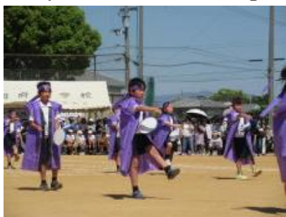
3年生「はいさい!心ひとつにエイサー」「ダンシング玉入れ」