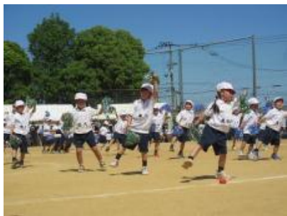
1年生「ジャンボリミッキー」「ダンシング玉入れ」

P.T.A役員の方々をはじめ保護者の皆様には、当日の準備や運営、テントの片付け等、ご協力いただきまして、大変ありがとうございました。