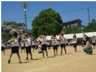
2年生「レッツ・カリスマックス!」「ダンシング玉入れ」