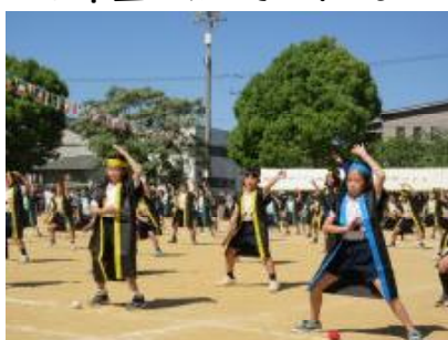
4年生「KOKUFU'S SOHRAN 2026」「引きすぎて滅!」