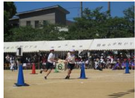
5年生「LET'S AWA DANCE 2026」 「運命のサイコロ」