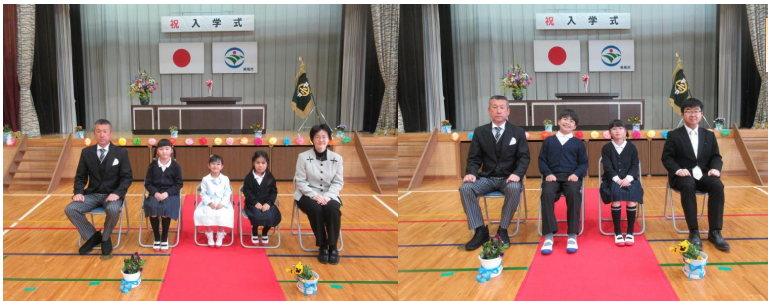
R8スタート！・入学式