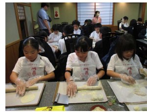
2日目八つ橋作ったよ！金閣まぶしく目を細め