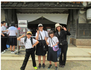
お化け屋敷は余裕だな!?

1日目は、大阪城で雷雲が近づいてきましたが、雨に降られることなく各所を回ることができました。奈良の大仏殿では、全員が柱の穴くぐりができました。「無病息災」「祈願成就」のご利益があると言われていいます。奈良公園では、鹿と戯れる横瀬の子がほとんどいない。みんなビビっていたのかな？