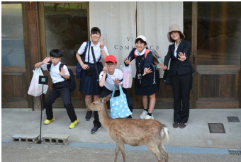
「鹿が怖い」と逃げ回り、夜はホテルでご満悦！