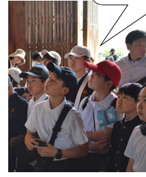
「大仏様はでかい」と感心し、柱の穴をくぐったよ！