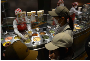
マイカップヌードルを作り、大阪城で「ハイチーズ」

5月13日(水)～14日(木)、6年生が生比奈小学校の19名とともに、大阪、京都、奈良へ修学旅行に行ってきました。