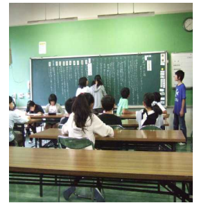
代表委員会でエコで話し合い