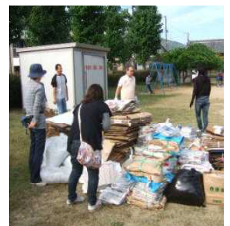
毎月第三土曜日にPTAの方々による資源回収