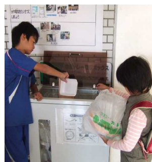
家庭のトレイを回収して資源に