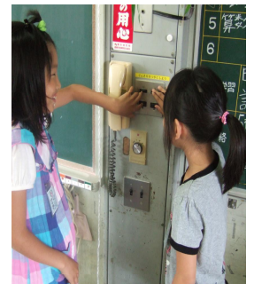
こまめに電気のスイッチを消す