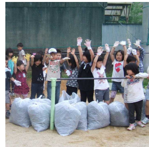
全校で学校ゴミ0運動