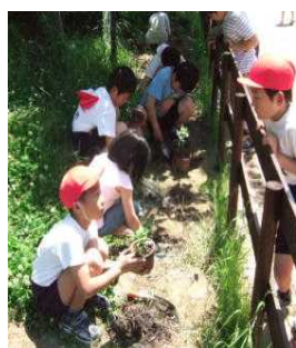
枯れ葉や草などを堆肥にして菊を植えている