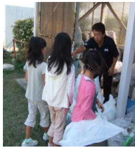
学級から出るゴミの分別をしている。