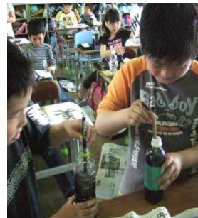
ペットボトルで節水