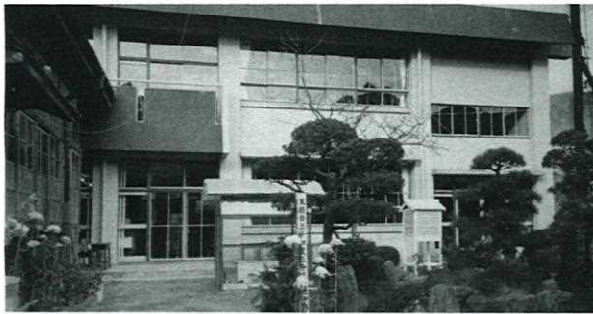
第2期工事直前の本校舎・中庭・木造校舎