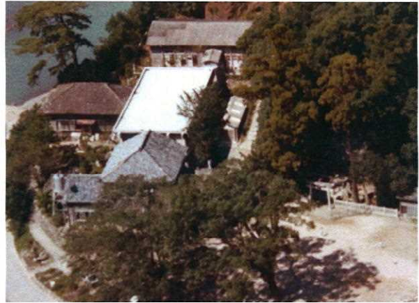
昭和46年頃の校舎の様子