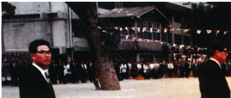
創立百周年記念祝賀パレード