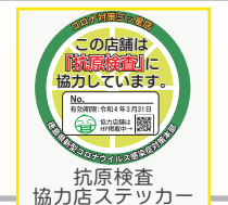
抗原検査 協力店ステッカー

「ガイドライン実践店ステッカー」及び「とくしまコロナお知らせシステム」に 登録済みの飲食店及び宿泊施設は、県に申請していただければ、 従業員の体調不良時に使用できる「抗原検査キット」を配布します。