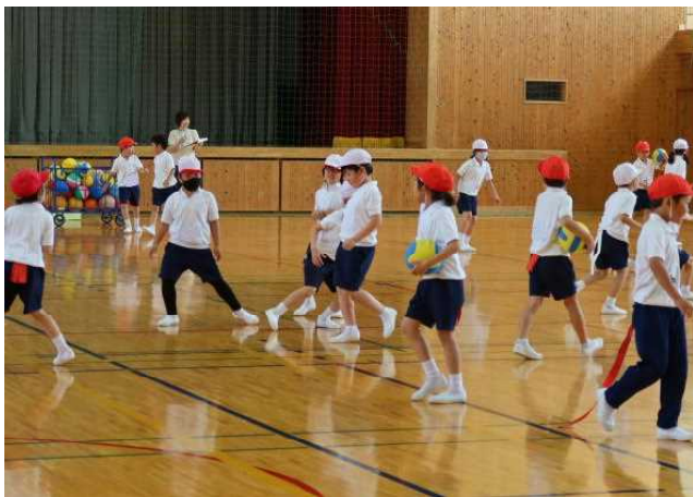
← 2-1 体育