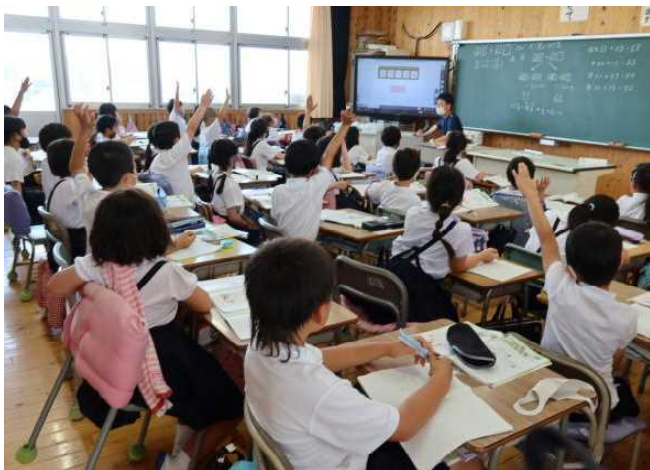
← 3-1 算数