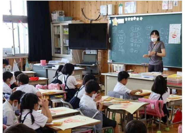
→ 1-2 図工