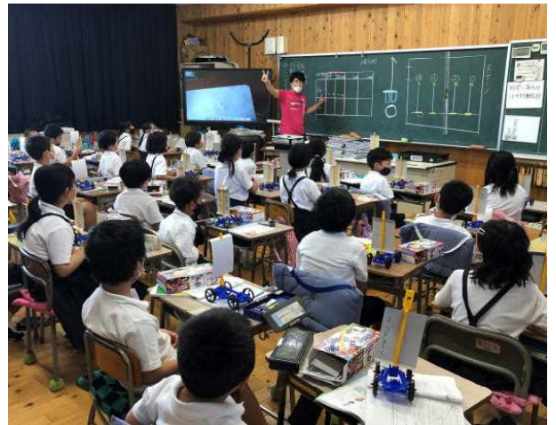
→ 3-2 理科