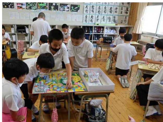
ボードゲームクラブ