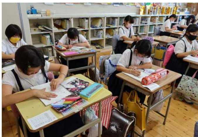
マンガ・イラストクラブ