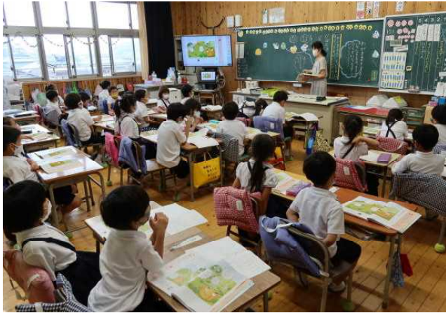
← 1-1 道徳