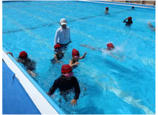
→ 2-2 体育