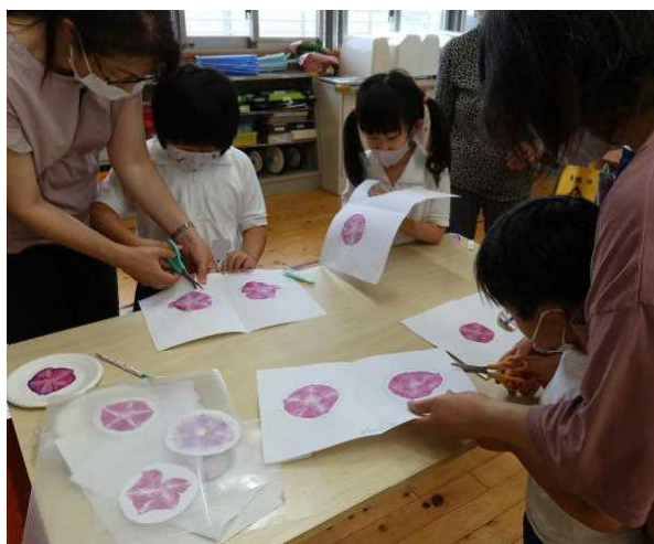
生活科「あさがお遊び」