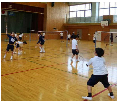
バドミントンクラブ