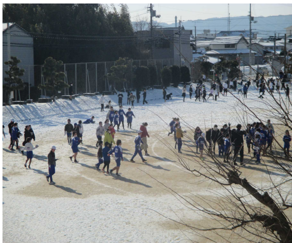
久しぶりの雪遊び

充実した令和3年度のまとめをして春休みを迎えるようにしたいと思いますので、ご家庭でもコロナ対策とともに、学習、生活のご指導をよろしくをお願いします。