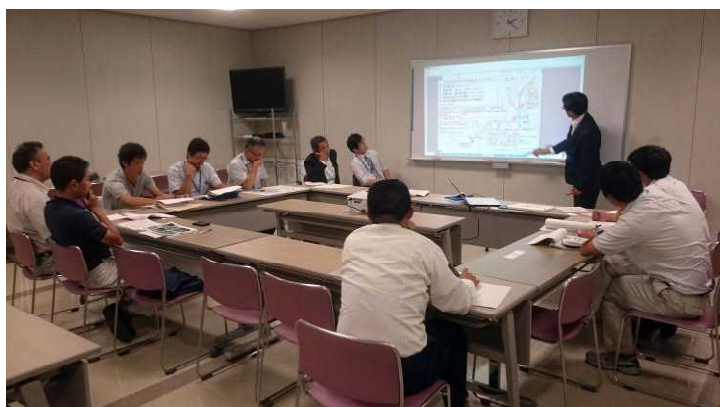
通学路安全対策会の様子