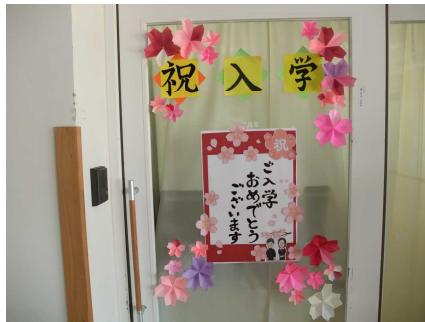
給食室による「入学お祝い」掲示