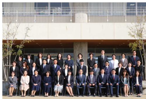
令和3年度小松島南中学校職員