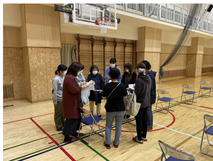
各部会の話し合い