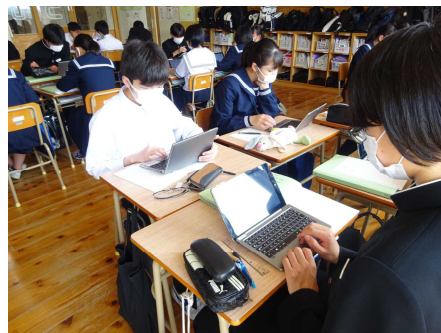
タブレット端末を使って（3年理科）