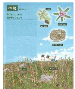
二十四節気のえほん 西田めい 文 羽尻利門 絵 PHP 研究所 より

3月5日(土)は、二十四節気の一つ「啓蟄(けいちつ)」でした。「啓」は開く、「蟄」はカエルなどの小動物で、冬眠をしているカエルやヘビたちが土の中から出てくる頃を意味しています。校内でもたくさんの花が咲き始めており、季節は確実に春に向かっていきます。令和3年度の締めくくりをして、しっかりと令和4年度の準備をしていきたいと思いました。