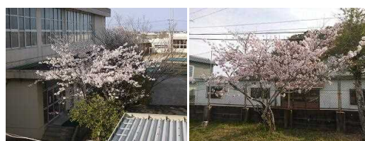
3月30日(水)の校内の桜の様子です。学校でも桜たちは満開でした。