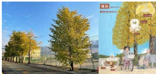
二十四節気のえほん 西田めい 文 羽尻利門 絵 PHP 研究所 より

10月23日(土)は、二十四節気の一つ「霜降(そうこう)」でした。霜降とは「霜が降り始めるころ」だそうです。今年は10月中旬までは暑かったのですが、10月18日(月)頃から急に寒くなったので本当に霜が降りるのではないかと思うくらいでした。長生小学校の校区の阿南第一中学校では、今年もイチョウ並木がだんだん色づいてきました。この後、並木全体が黄金色になり、道路が金色の落ち葉のじゅうたんを広げたようになって、多くのギンナンも落ちるといことです。これからも気を緩めずに新型コロナ対策を徹底しながら、温かくして風邪を引かないように気をつけていきたいと思います。