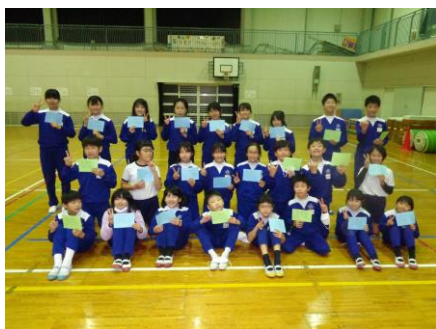
【校内体操検定の様子】