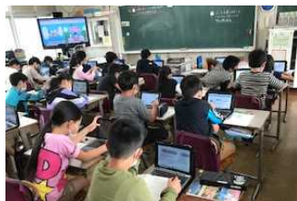
【4年生のタブレットを使った調べ学習の様子】