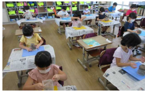
【初めての楽焼きに挑戦する1年生】