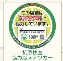
抗原検査 協力店ステッカー

「ガイドライン実践店ステッカー」及び「とくしまコロナお知らせシステム」に 登録済みの飲食店及び宿泊施設は、県に申請していただければ、 従業員の体調不良時に使用できる「抗原検査キット」を配布します。