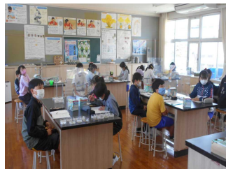
理科の実験の様子

現在、「理科の実験」「授業での班活動」「調理実習」「歌唱や演奏」等は、基本的な感染対策をとって実施しています。感染状況によっては、活動の制限もございます。ご了承ください。