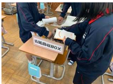
教室での古紙回収