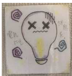
節電を呼びかける掲示①