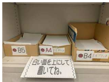
印刷室で古紙回収 サイズ別に分類し整頓