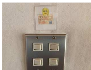
節電を呼びかける掲示②