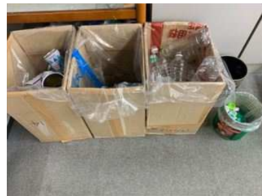
職員室でのごみの分別