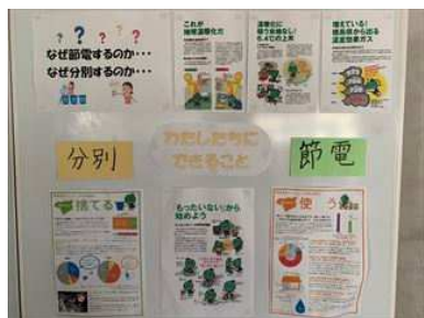
環境 ISO コーナーの設置