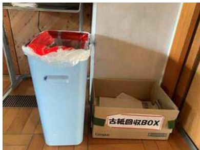
教室でのごみの分別