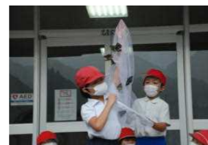
オオムラサキ放蝶