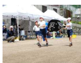
下名校区大運動会