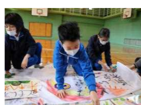
復興鯉のぼり制作