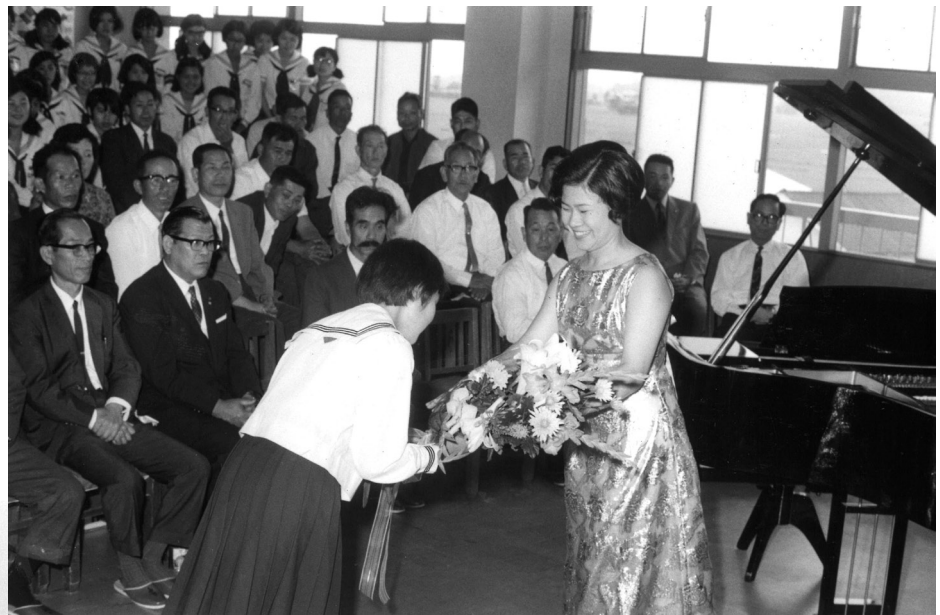
昭和44年 特別教室(調理室、理科室、音楽室)の落成記念行事