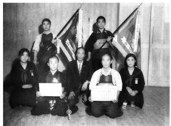
昭和44年 剣道部(県総体団体準優勝)