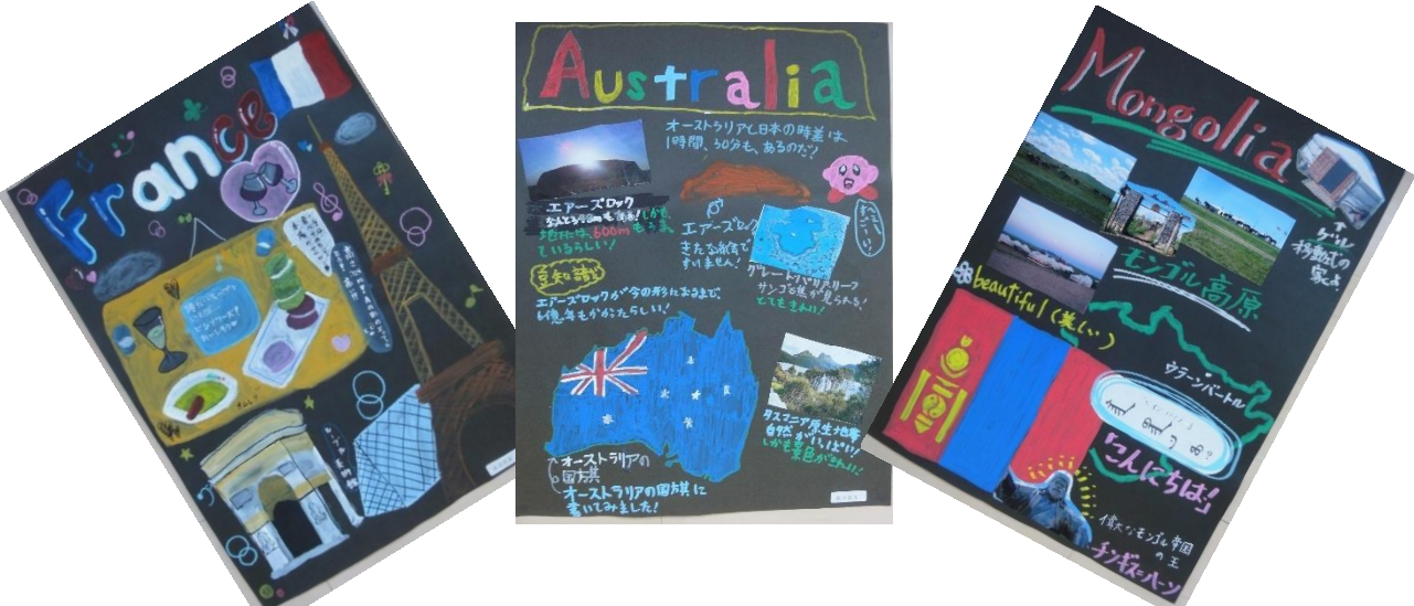
6年生 「Let's go to Italy.」 Lesson 5 (図工科「好きな国をデザインしよう」と関連)