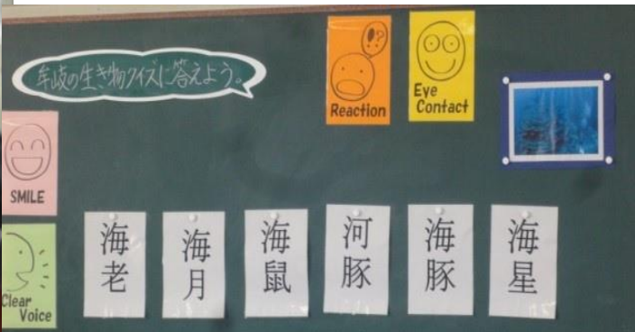
5年生 「What's this?」 Lesson 4 (学校行事 宿泊学習と関連)