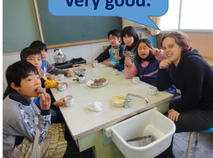
5年生 「What would you like?」 Lesson 9 (家庭科「家族とほっとタイム」と関連)