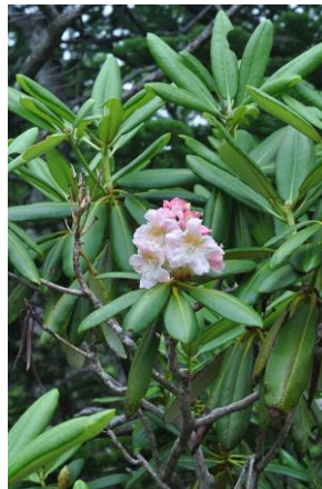
ハクサンシャクナゲ