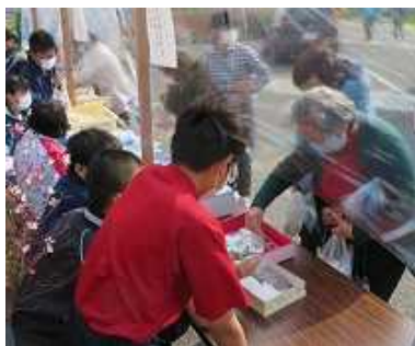
第1回の販売内容分析と経験を活かして、売り上げは45%アップ！！