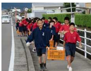
豊作の収穫を終えて