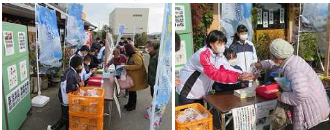
クジでおイモが当たる企画も大成功！