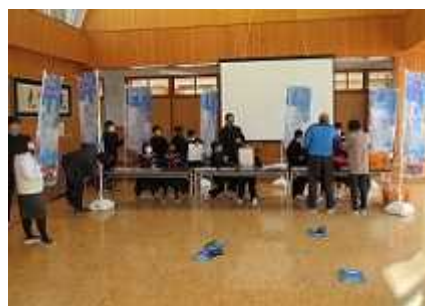
多目的ホールに集合して、地域貢献セールの販売所を設置してのシュミレーション(12/4)