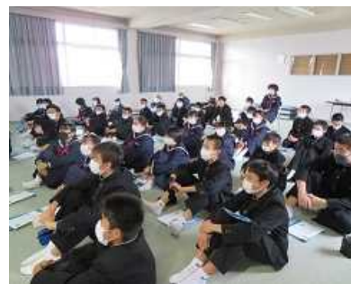
全員で「藍染めハンカチ」の価格決定会議(11/20)