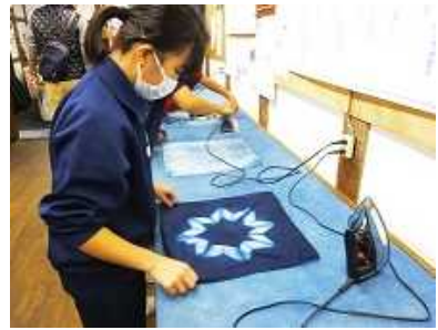
藍の館でのこの体験が、学校での藍染めハンカチ作成に役立ちました。(11/2)