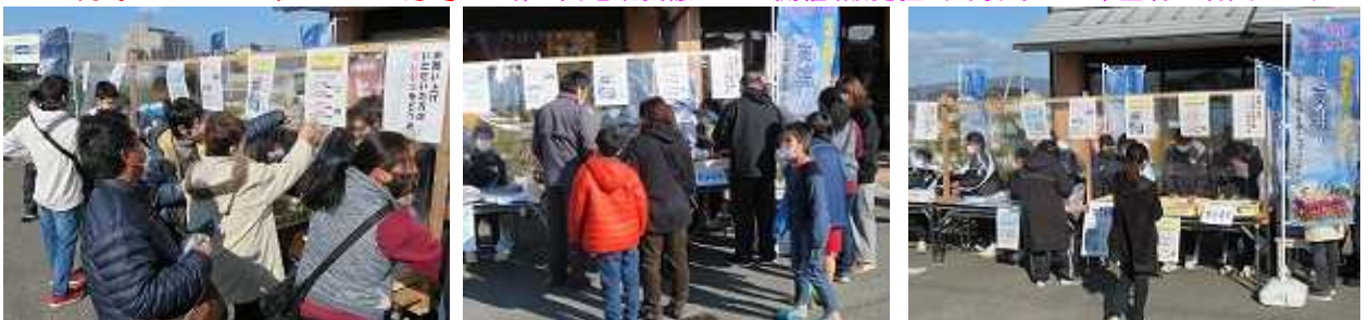
食感UPのためにケーキのカットは厚さを1.5倍に、藍染めハンカチもサイズを大・中・小と揃えての販売です