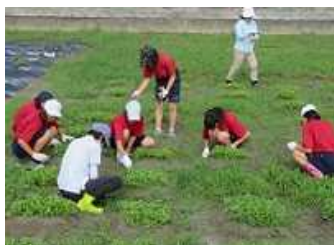
藍の苗の植え替え