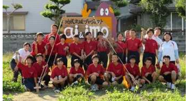
10月2日の「紅はるか」の収穫後の記念撮影(左:1年A組 右:1年B組)