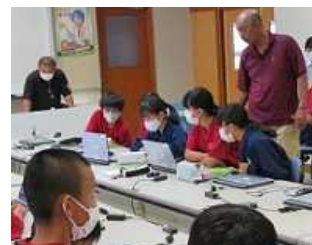
地域店舗のチラシ作り