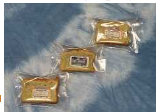
ai & imo Takaura パウンドケーキ(左:カット, 右:ロング)