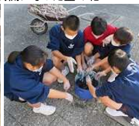
藍染めハンカチ制作中