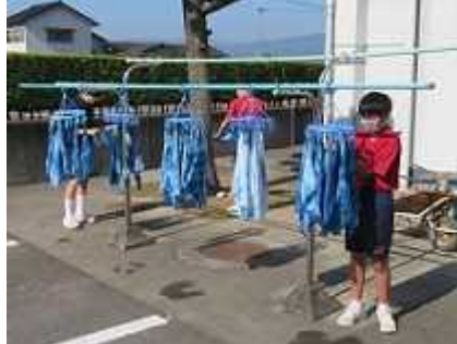
出来上がったハンカチを干す