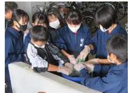
「乾燥葉染め」でハンカチを染めていきます。(11/10・17)〈左:染料の説明 中:柄を決める 右:染める〉