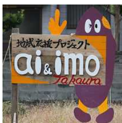
完成した農園の看板