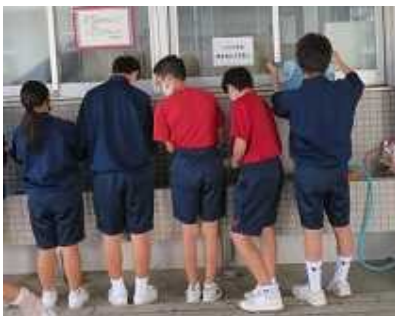
水洗いで色が劇的に鮮やかに