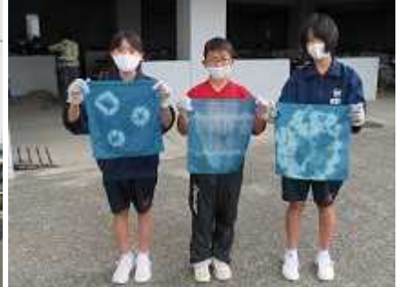
世界で一つの「藍染めハンカチ」完成！