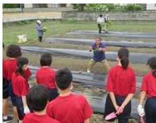
イモの苗植え講習