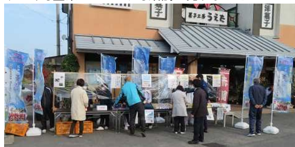
第2回地域貢献セール開催〈販売担当：1B〉(12/12)