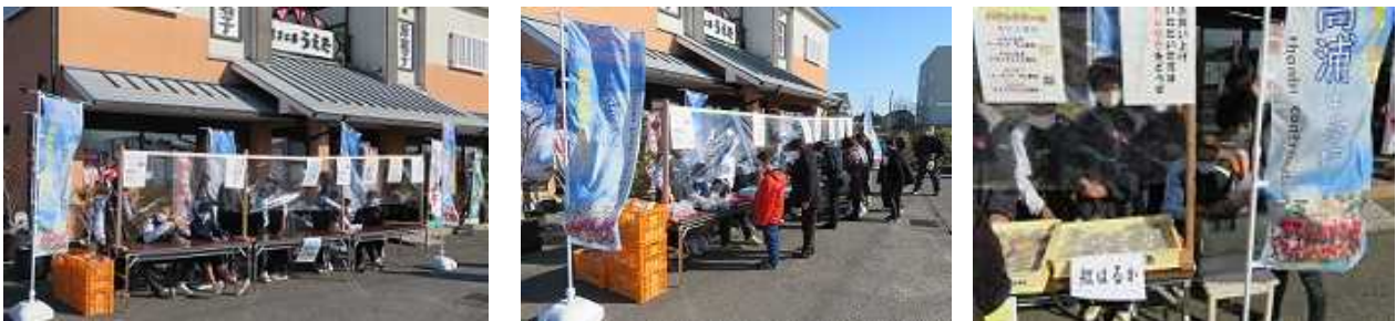
“徳島マルシェ”中止による急遽の 第3回地域貢献セール開催(販売担当:両クラスの希望者16名)(1/30)