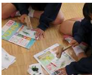
たたき染めの葉づくり