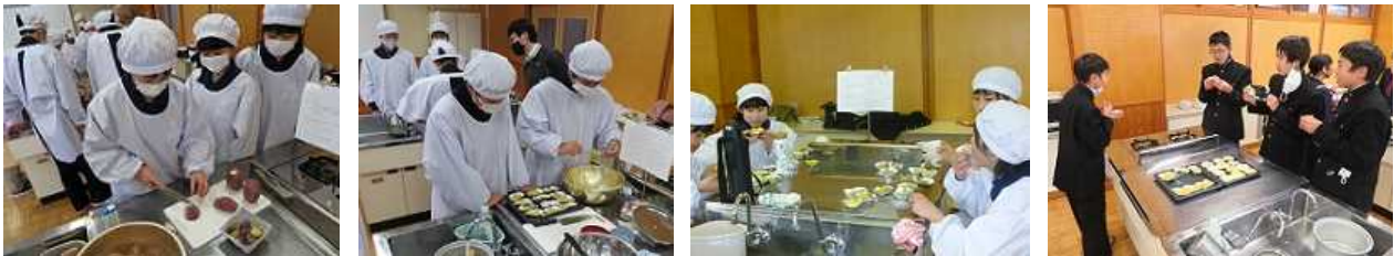
「紅はるか」を使った“スイートポテト”“カップケーキ”づくり(1B:1/22、1A:1/29)取組のご褒美!?