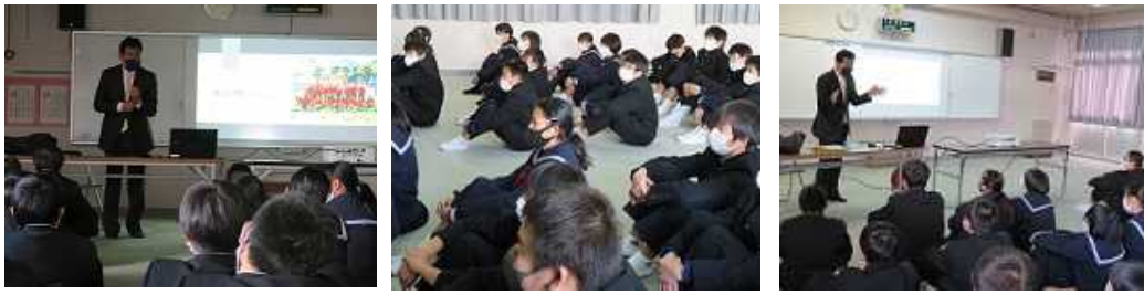
取組を4つのカテゴリーに分け、活動を振り返りました(12/18)