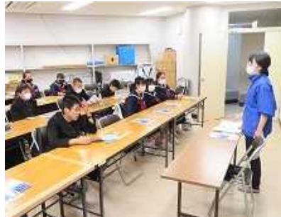
エディの原館長さんに「働くこと」への心構えは、「誇り」と「準備」と教わりました。