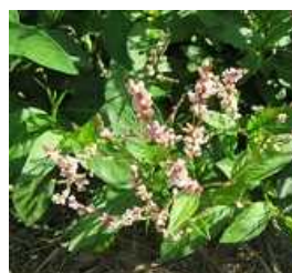
満開になった藍の花