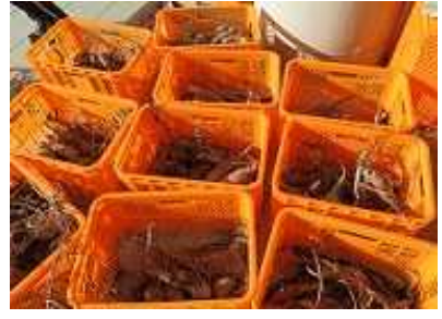
10月2日の「紅はるか」収穫の様子