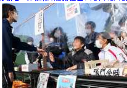
笑顔でお客さんに対応