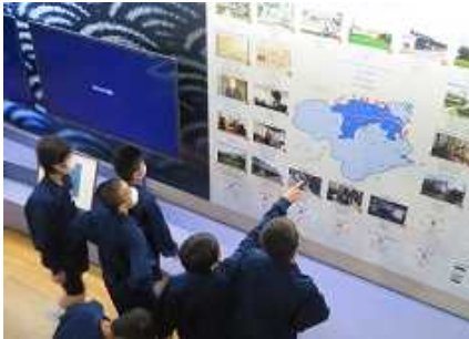
徳島の藍について学ぶこともできました。