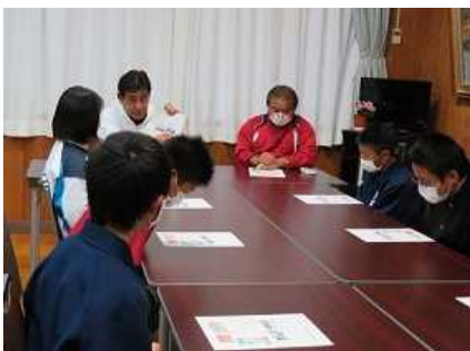
校長室での販売促進会議(11/18)